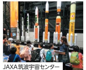
JAXA 筑波宇宙センター