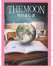
【制作・配給】 コニカミノルタプラネタリウム株式会社