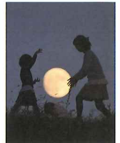
大賞作品「月と遊ぶ」