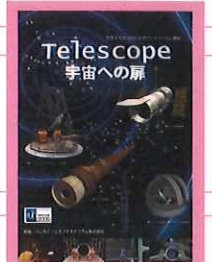
配給 コニカミノルタプラネタリウム