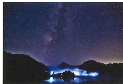
名誉館長特別賞 「天に天の川地に霧の只見川」