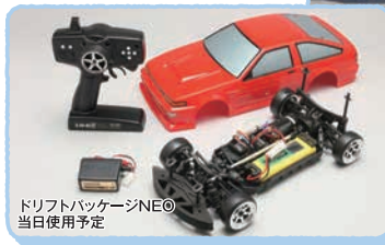
ドリフトパッケージNEO 当日使用予定