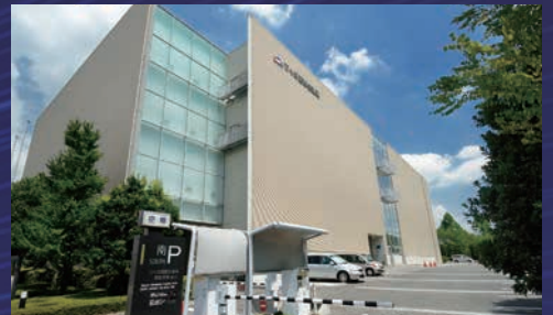
つくば国際会議場 1F多目的ホール(627m)

新型コロナウイルス感染防止のため、 大きなホールを使って密にならない環境で実施します。