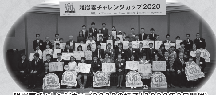
脱炭素チャレンジカップ2020の様子(2020年2月開催)