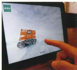
南極ウォークビュー(iPadアプリ)

昭和基地の中はどうなっている? 屋外ではどんなものを使うの? 南極観測隊の活動や生活をのぞいてみましょう。