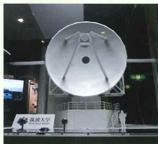
南極10mテラヘルツ望遠鏡(計画中)模型

南極で行われている観測や研究を紹介します。 南極10mテラヘルツ望遠鏡模型を動かしてみよう。 オーロラの映像も楽しめます。