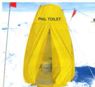
ペール缶トイレ